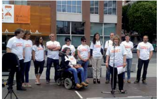
Lectura del manifest el passat dia 21 de juny, a la plaça de la Vila

La Marató de TV3 d'aquest any, que se celebrarà el 15 de desembre, estarà dedicada a les Malalties Neurodegeneratives, que inclouen tot un seguit de patologies cròniques i progressives del sistema nerviós central ocasionades per la pèrdua continuada de neurones del cervell i de la medulla espinal. Aquesta pèrdua ocasiona l'alteració dels complexos circuits neuronals i com a conseqüència, les persones pateixen greus canvis físics o conductuals que impliquen gran dependència i una alteració directa de l'entorn familiar durant anys. Entre aquestes malalties trobem l'Alzheimer, l'esclerosi múltiple, la corea de Huntington, el Parkinson, la distròfia muscular o l'esclerosi lateral amiotròfica (ELA). La Plataforma per a l'autonomia personal és una entitat de Sant Adrià de Besòs que promou la vida independent de les persones amb diversitat funcional. Aquesta associació ha demanat la col·laboració activa de tot el municipi en la Marató de TV3 i, en consonància amb els objectius que persegueix la Marató, donar a conèixer i sensibilitzar els ciutadans sobre l'existència de l'ELA, les necessitats de les persones que la pateixen i la necessitat de recollir fons per a la investigació, fent una aportació conjunta de la ciutat de Sant Adrià a la Marató. Des d'ara fins a finals d'any es duran a terme diferents accions, promogudes per entitats i l'Ajuntament. El tret de sorti-