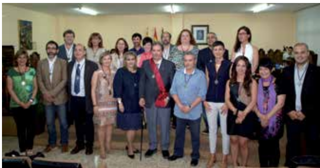
En acabar el ple la nova corporació es va fer la foto de família

de treballar per "continuar mantenint un Ajuntament sòlid i sanejat, un dels més sanejats econòmicament de Catalunya, capaç de sostenir els serveis" .