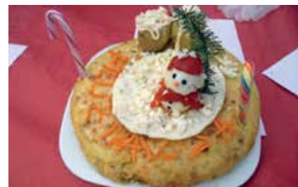
La truita guanyadora