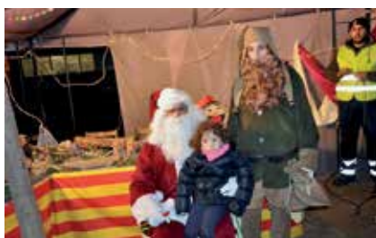
El Pare Noel a la Fira de Nadal