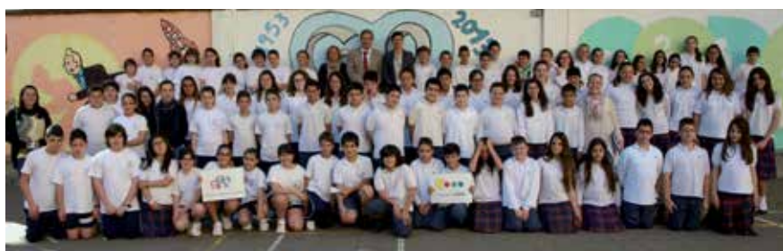
Alumnes de sisè de primària de l'escola Amor de Déu

El projecte Cultura Emprenedora a l'Escola és una iniciativa organitzada per l'Àrea de Promoció Econòmica i subvencionada per la Diputació de Barcelona, que presenta com a objectiu general promoure hàbits i comportaments emprenedors entre l'alumnat.