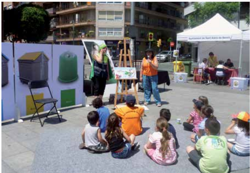
Una de les activitats que van tenir lloc a la Festa del Medi Ambient de l'any passat

Cal destacar la implicació de les entitats i associacions que participen organitzant diverses activitats i que any rere any fan possible que la Festa tiri endavant. A més d'aquestes activitats, hi haurà un circuit de bicicletes per als més petits, organitzat pel Club Ciclista Besòs, un taller de reparació de bicicletes amb el suport de l'Associació de Veïns de la Mina i un taller sobre aigua i un altre de consum responsable, cedit per l'Àrea Metropolitana de Barcelona a través del programa Compartim un Futur. D'altra banda, la Diputació de