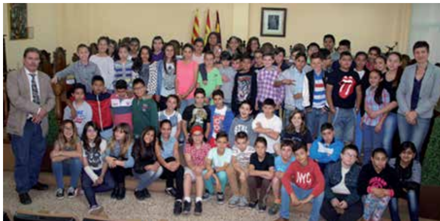
Alumnes de sisè de primària de les escoles Pompeu Fabra i Cascavell

L'alumnat de sisè de primària de cada centre s'han constituït en cooperativa per fabricar i vendre productes artesans. El projecte l'han desenvolupat al llarg del curs i han treballat de manera transversal matèries com matemàtiques, llengua, medi, plàstica, informàtica, i també capacitats i habilitats emprenedores com ara la iniciativa, la