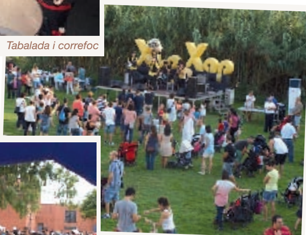
Festa del riu