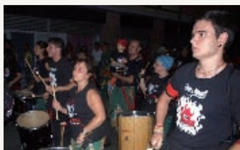
Tabalada i correfoc