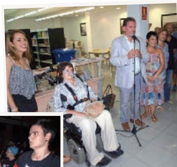
L'Arxiu Municipal passa a dir-se Arxiu Municipal Isabel Rojas Castroverde