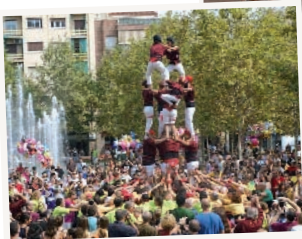
Actuació dels Castellers de Sant Adrià