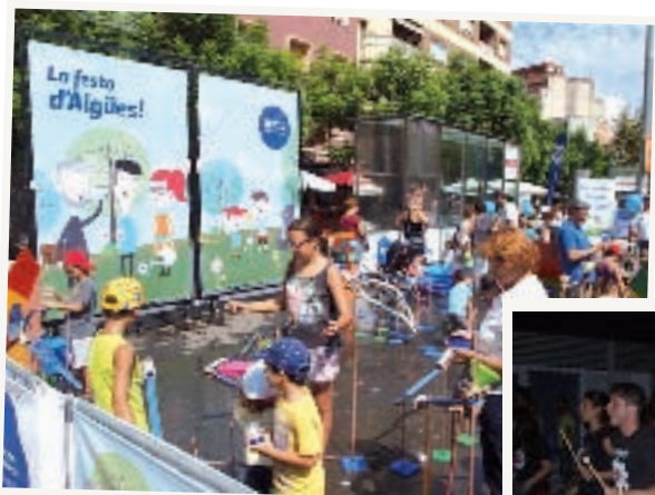
Festa de l'Aigua