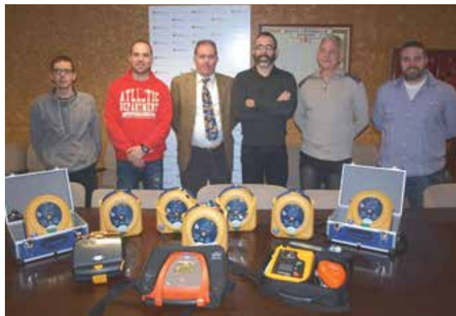
L'alcalde amb el regidor d'Esports i representants de la Policia Local de Protecció Civil i del Departament de Prevenció i Riscos Laborals

D'altra banda, el passat mes de desembre Protecció Civil, a través de l'empresa CatRisc, va formar 76 treballadors municipals en l'ús dels desfibril·ladors i en l'aplicació de tècniques de reanimació.