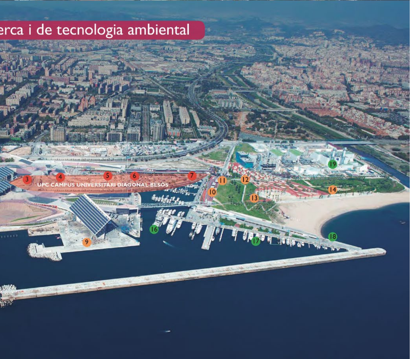
UPC - Campus Diagonal Besòs