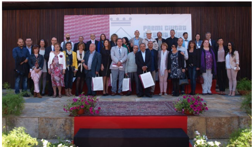
Imatge dels Premis Ciutat de Sant Adrià 2014

El premi atorgat pels ciutadans té com a objectiu principal fomentar la participació dels adriana i adrianaques