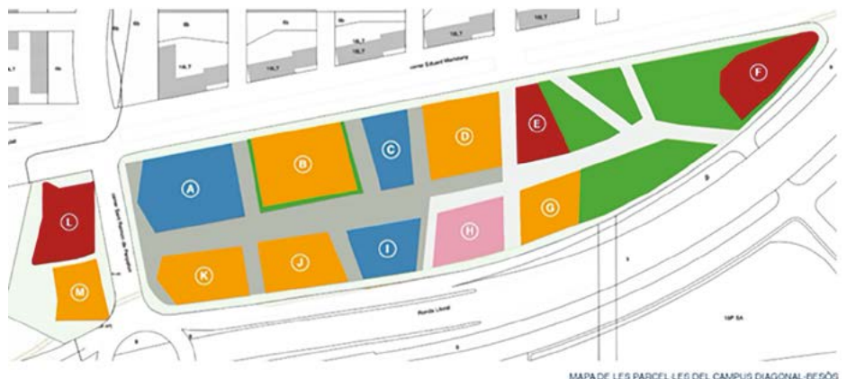
MAPA DE LES PARCEL·LES DEL CAMPUS DIAGONAL-BESÒS

Els edificis que hi ha actualment són l'edifici de docència i serveis de l'EBEE (edifici A), amb 20.000 m 2 de superfície sobre rasant que concentren les activitats de docència, els serveis i els espais de gestió; els edificis de recerca (C), amb 5.750 m 2 de superfície, i (I), amb 6.330 m 2 , on s'han situat els grups i centres de recerca (essencialment de les àrees d'energia, d'enginyeria biomèdica, d'enginyeria química i d'enginyeria de materials) i el Centre de Recerca en Ciència i Enginyeria Multiescala de Barcelona. Així mateix, hi ha la residència Diagonal-Besòs (edifici H) per a estudiants, professors i investigadors, que es va posar en marxa el quart trimestre de 2019.