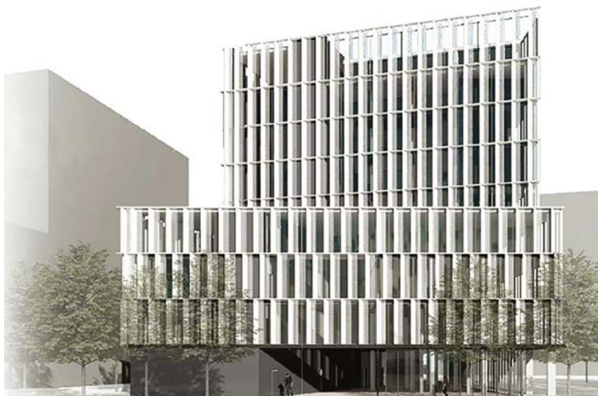
Render del nou edifici per a pimes, empreses emergents i espais de cotreball.

L'edifici es destinarà a activitat econòmica i s'hi ubicaran pimes i empreses emergents sorgides dels grups existents o amb presència al Campus, o