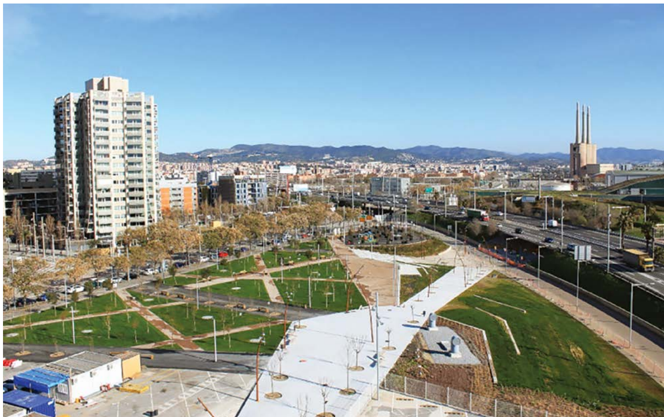
El nou parc del Campus Diagonal-Besòs que connecta amb el parc de la Pau i el Port Fòrum.

bla de la Mina amb l'àmbit del Port Fòrum i obre l'accés al mar tant a la comunitat universitària com als veïns dels barris de l'entorn. Amb la urbanització d'aquesta àrea s'han volgut ordenar els espais lliures que constitueixen el parc del Campus i el seu àmbit de connexió externa. Un cop acabat l'any 2019 l'eix central per donar servei al Campus i la seva connexió provisional amb la plaça del Fòrum, faltava per desenvolupar el parc i les seves connexions urbanes. Per això, junt al desenvolupament del parc, s'ha millorat l'actual pas sota la ronda del Litoral cap als carrers de la Pau i l'avinguda de Francesc Botey. El pressupost del projecte ha estat d'uns 3,6 milions d'euros i s'ha desenvolupat a la parcel·la P1 del Campus, amb l'objectiu de connectar els barris del Besòs i el Maresme de Barcelona amb la Mina de Sant Adrià, el Port Fòrum i el Campus. És ja la seva principal zona verda i de lleure, la qual inclou un parc infantil per als més petits i una pista de futbol i bàsquet, pistes en què tant la comunitat