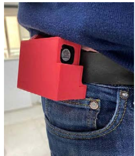
Imatge d'un sensor mòbil

La contaminació de l'aire, provocada en gran part pel trànsit rodat, traspasa les fronteres locals i és un greu problema present a les grans conurbacions urbanes i metròpolis del món, consegüentment també a l'Àrea Metropolitana de Barcelona. Per millorar la qualitat de l'aire, que afecta directament la salut pública dels 3,2 milions d'habitants de la metròpolis de Barcelona (integrada per 36 municipis), l'AMB lidera una ambiciosa estratègia de lluita contra la contaminació atmosfèrica, amb una total complicitat i col·laboració entre els ajuntaments metropolitans que hi treballen. S'està dissenyant i posant en marxa nous serveis i eines i implementant mesures destinades a reduir notablement els nivells de concentració de partícules en suspensió (PM 2,5 i