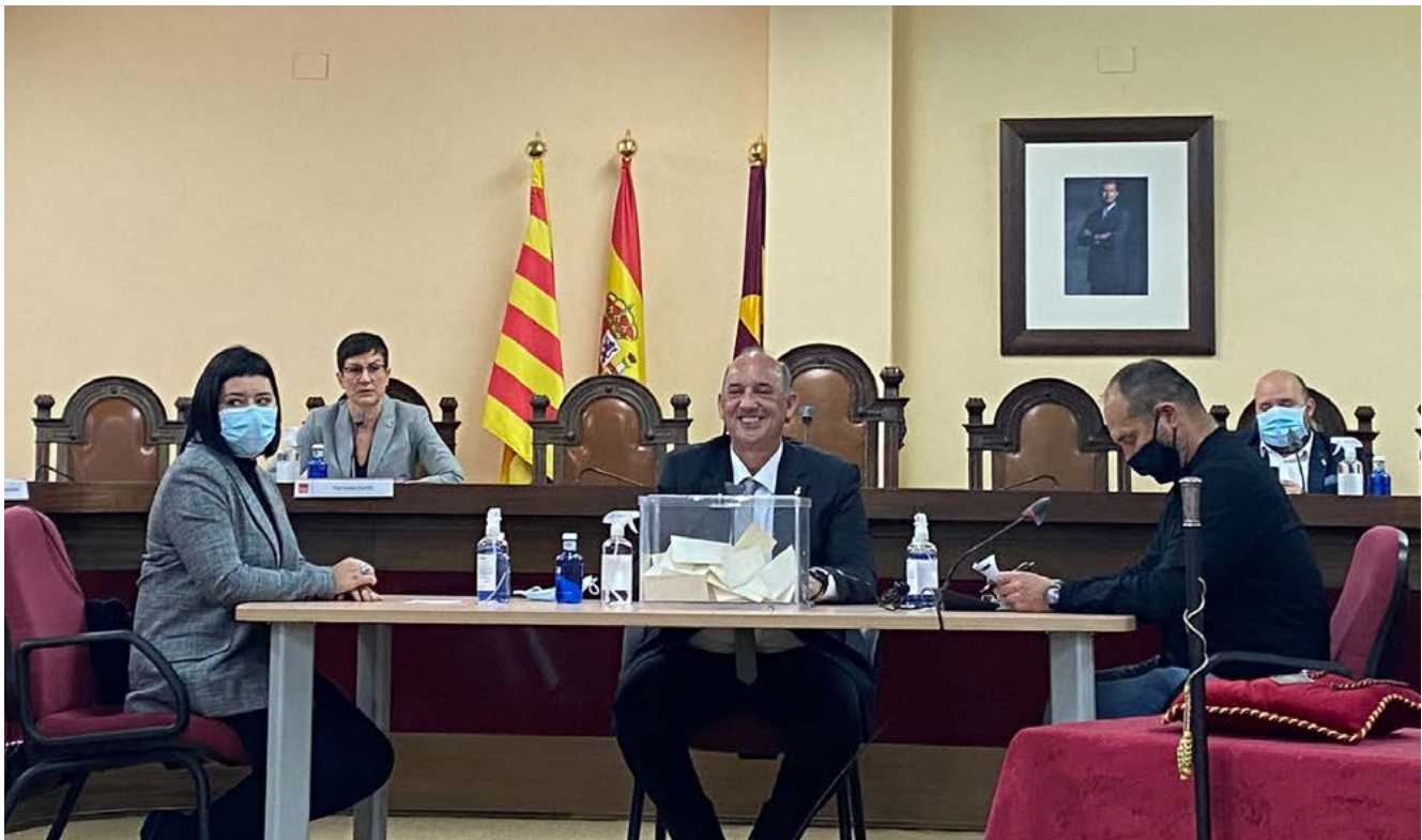
Imatge del Ple d'Investidura