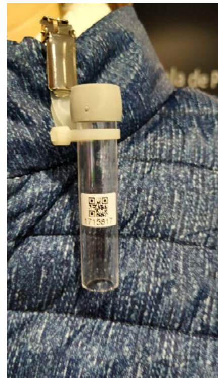
Imatge d'un captador passiu.

(PM 10 ). Es tracta d'una pantalla interactiva que també informa de la prova pilot que s'està duent a terme i fa recomanacions a la ciutadania en relació amb la contaminació atmosfèrica. Amb les dades obtingudes dels sensors, es podrà elaborar un mapa de punts especialment conflictius en què es puguin aplicar mesures addicionals: conversió de carrers en zones de vianants, foment dels desplaçaments a peu o bicicleta, promoció del vehicle elèctric, punts de recàrrega i campanyes de sensibilització i educació adreçades a la ciutadania. Amb l'objectiu de disminuir la contaminació a la ciutat, Sant Adrià ja forma part de la Zona de Baixes Emissions-Rondes, i la participació en aquest projecte permetrà continuar millorant la qualitat de l'aire i la qualitat de vida dels ciutadans.