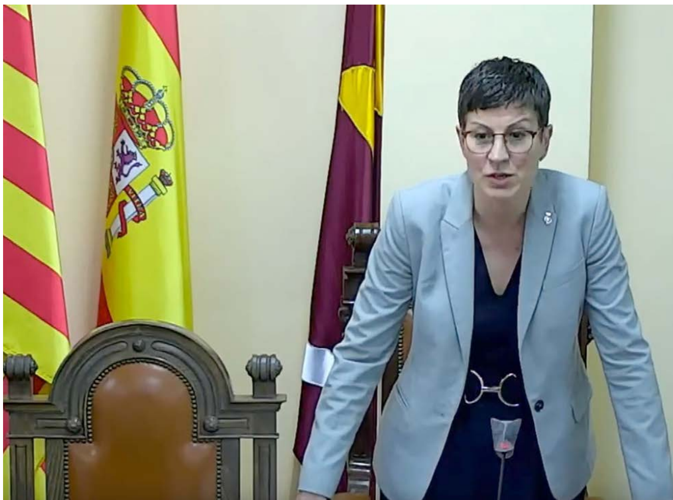
La nova alcaldessa durant la sessió extraordinària del Ple

La seva prioritat serà l'àmbit social: ocupació, habitatge, atenció social i educació