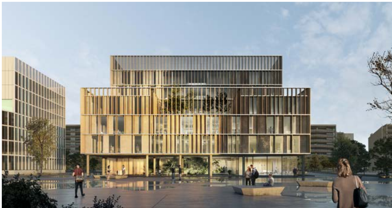
Vista frontal del futur Edifici D del Campus Diagonal-Besòs de la UPC

El centre de recerca, promogut per l'INCASÒL, comptarà amb una inversió de més de 24 milions d'euros i 14.352 m 2 destinats essencialment a la investigació en energia, sostenibilitat i enginyeria biomèdica.