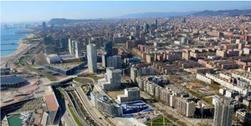
Campus Diagonal-Besòs amb els terrenys on es construirà l'Edifici D

Actualment al Campus hi ha quatre edificis en marxa: un de docència, dos edificis de recerca i la residència per a estudiants, investigadors i docents. Una vegada el projecte estigui del tot desenvolupat, el Campus comptarà