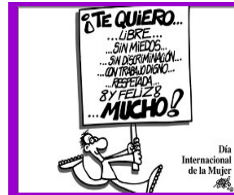
Vinyeta de l'exposició "La violència no fa riure"